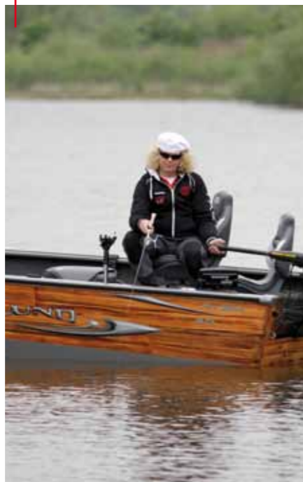
Soms zie je geen enkele vis op de sonar, maar vang je ze vervolgens wel!

Water- en stekkennis zijn volgens mij altijd enorm belangrijk. Je kunt immers uren vissen op een plek waar geen vis zit en denken dat ze niet willen bijten. Het is echter altijd moeilijk om zeker te weten of er vis zit. Natuurlijk hebben we