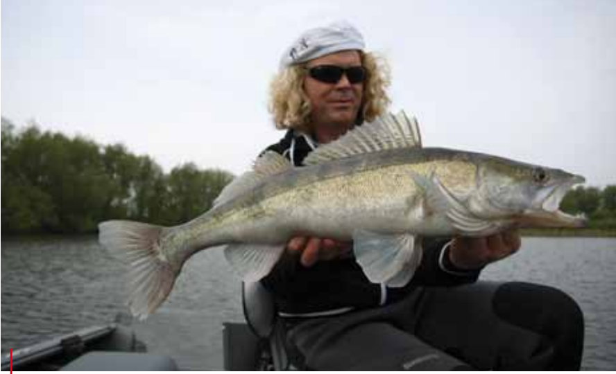
Je kunt op allerlei manieren variëren.

zen ophouden. Opvallend is, dat de vis hier vaak het hele jaar zit. De harde randen zijn een ultieme omgeving om te jagen. Ze trekken prooivissen aan omdat er vlokkreeftjes en andere diertjes leven. Dergelijke stekken zijn goud waard. Heb je eenmaal een aantal van deze stekken in je eigen bestand of gps, dan kun je daar experimenteren met technieken. Zoals eerder gezegd zitten de verschillen vaak in details. Op wateren als het Hollands Diep en Haringvliet heb je te maken met opkomend en afgaand water. Je merkt dit goed als er weinig of geen wind staat. Probeer ook hier op te letten: bij welk tijdstip krijg je het meest beet? Een panklaar recept bestaat hier niet voor. Net als bij langzaam verticalen balanceer ik ook met normaal verticalen mijn hengel uit. Ik doe er net zoveel gewicht in dat de top iets richting water hangt. Hierdoor wordt ik min of meer gedwongen om mijn top omhoog te brengen. Om overal op voorbereid te zijn, heb ik drie hengels opgetuigd als ik ga verticalen: YASEI jigging MH en H (M=medium, MH=medium heavy, H=heavy) en YASEI Speedjigging. De hengels variëren in lengte van 1,85 meter tot 2,15 meter.